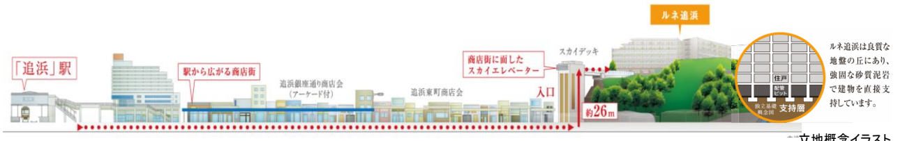
1 立地概念イラスト

駅からフラットアプローチで徒歩 11 分。商店街の賑わいを抜けて街の入口である「スカイエレベーター」へ。地上約 26m へノンストップのエレベーターはベビーカーや自転車でも快適に利用。京急本線特急停車駅「追浜」駅からは「横浜」駅へ 19 分、「品川」駅へ 36 分。また「東京」駅、「渋谷」駅、「新宿」駅へも 40 分台。ビジネスに、ショッピングに、軽快なアクセス。