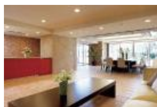
グランドラウンジ