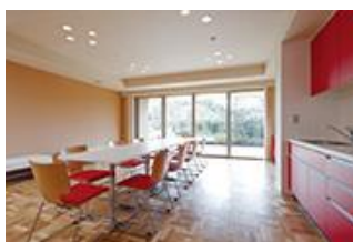
パーティールーム