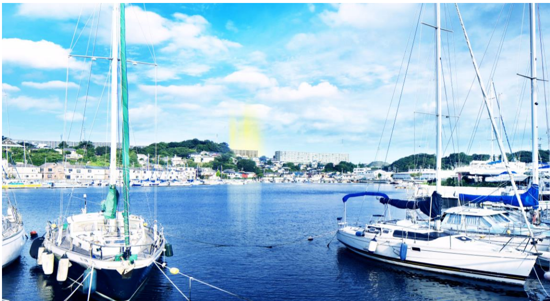
深浦湾より現地を望む(2015年9月撮影)

総合地所株式会社（本社：東京都港区、社長：関岡 桂二郎）は、これまで当社にて開発して参りました「ルネ追浜（神奈川県横須賀市、総開発戸数：420戸）」の最終街区となる『ザ・ヒルトップヴィラ ルネ追浜』（総戸数：107戸）の販売を開始する運びとなりましたので、ご案内させていただきます。