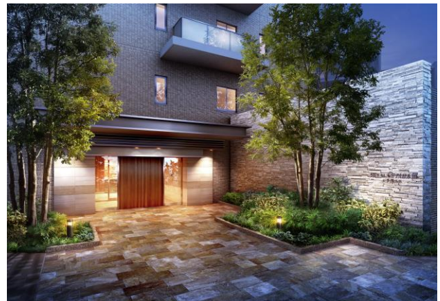
エントランス完成予想図