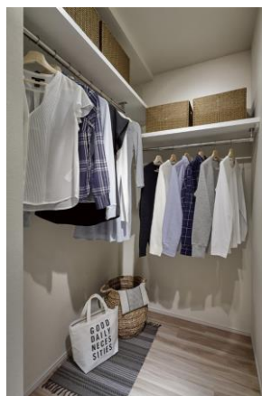
マルチクロゼット