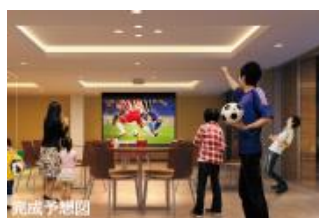
オープンラウンジ