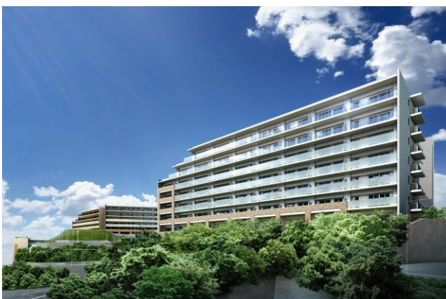
南西側外観完成予想図