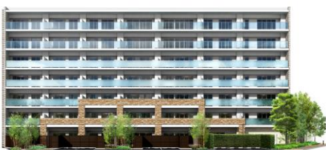
南西側立面完成予想図