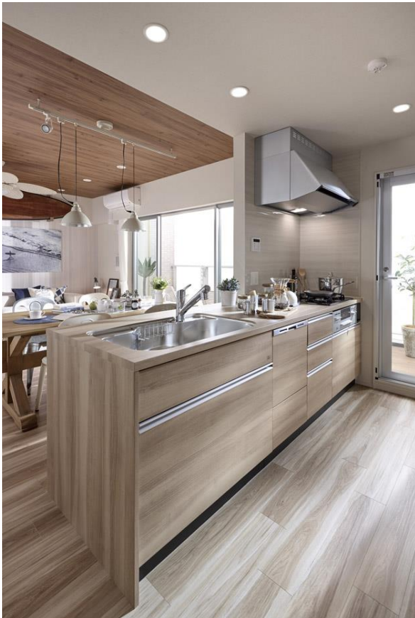
スタイリッシュキッチン