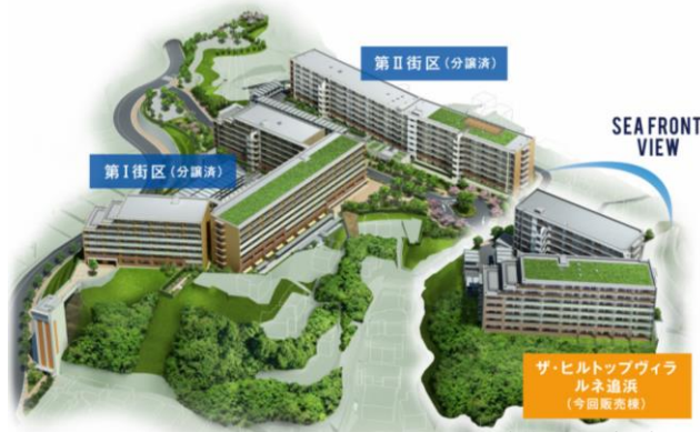
全体外観完成予想図

横浜・金沢八景を生活圏とする横須賀の最前席、追浜。総開発戸数 420 戸、緑豊かな丘の上に佇む交流の街「ルネ追浜」。街並を彩るのは家族の幸せな笑顔、聞こえてくる鳥の声。その一画、海と風に抱かれる大地を得て今、深い安らぎに抱かれる 107 邸のレジデンスが誕生。