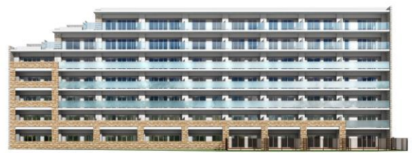
東側立面完成予想図