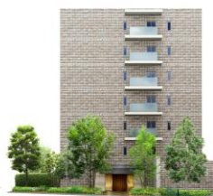
北側立面完成予想図